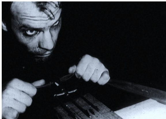
Кадр из к/ф « Вепри суицида » (Е. Юфит, 1988 г.; к/м)

кой – « Вепри суицида »), и год выхода в свет. Далее в кадре последовательно: вспышка света в небе, безэмоциональное лицо молодого мужчины, вид ночного дома с освещёнными окнами (эпизод длится 13 секунд), фигура мужчины – он курит, полужёжа в постели, закинув руку за голову. Спина его обращена к окну, за которым появляется некто – он стучит по стеклу, пытаясь привлечь внимание обитателя комнаты; тот приподнимается, подаётся телом к окну, открывает его и пожимает протянутую руку ночного гостя. Внезапно на экране появляется группа лётчиков в зимнем обмундировании. Затем зритель вновь возвращается в комнату; в оконном проёме – лицо мужчины, склонившегося над предметом, напоминающим большую